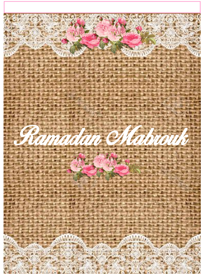
Chocolade wikkels Lidl mini repen