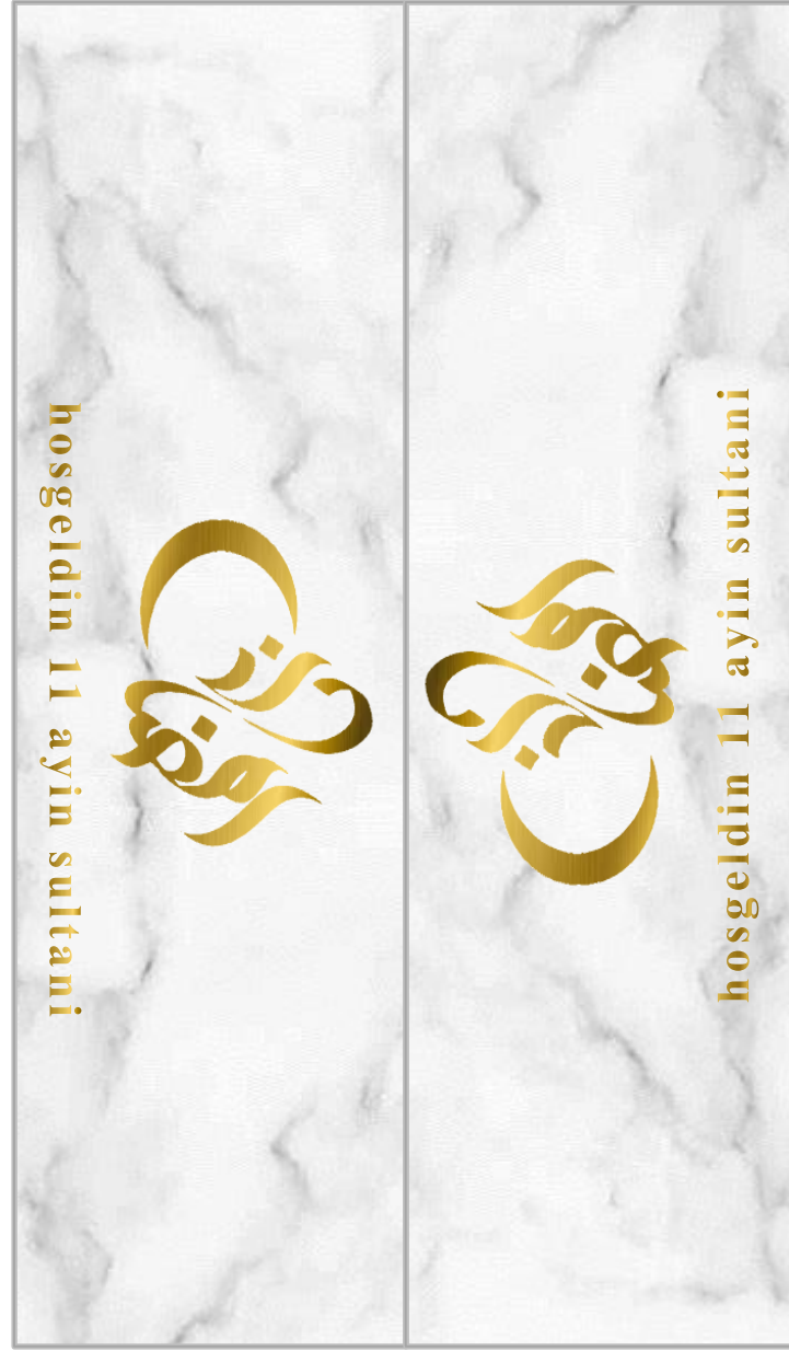
SNOEPZAK LABELS MAAT 15X15 VAN DE ACTION